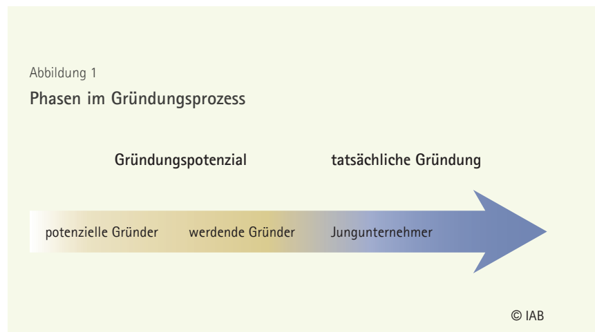
Abbildung 1 zeigt den zeitlichen Ablauf des Gründungsprozesses und die Zuordnung der drei Typen zu den einzelnen Phasen. Die Idee der Unternehmensgründung wird von links nach rechts konkreter, was mit einem Rückgang der Anzahl der in den Prozess involvierten Personen einhergeht.

Bei den weiteren Analysen stehen die drei Unternehmertypen für die unterschiedlichen Stadien, in denen sich der Gründungsprozess befinden kann.