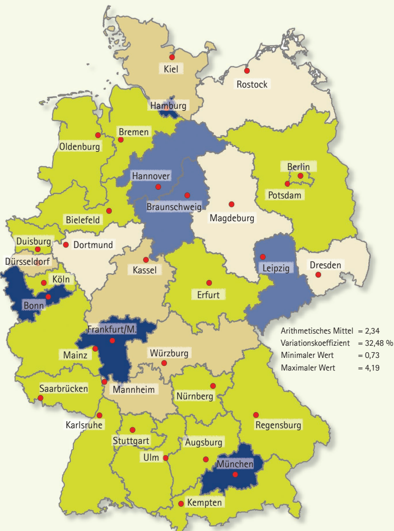
Jungunternehmer in 33 deutschen Regionen, Raten 2002 bis 2006

Anteile der Jungunternehmer in Prozent der 18- bis 64-jährigen Bevölkerung (jährliche Mittelwerte)